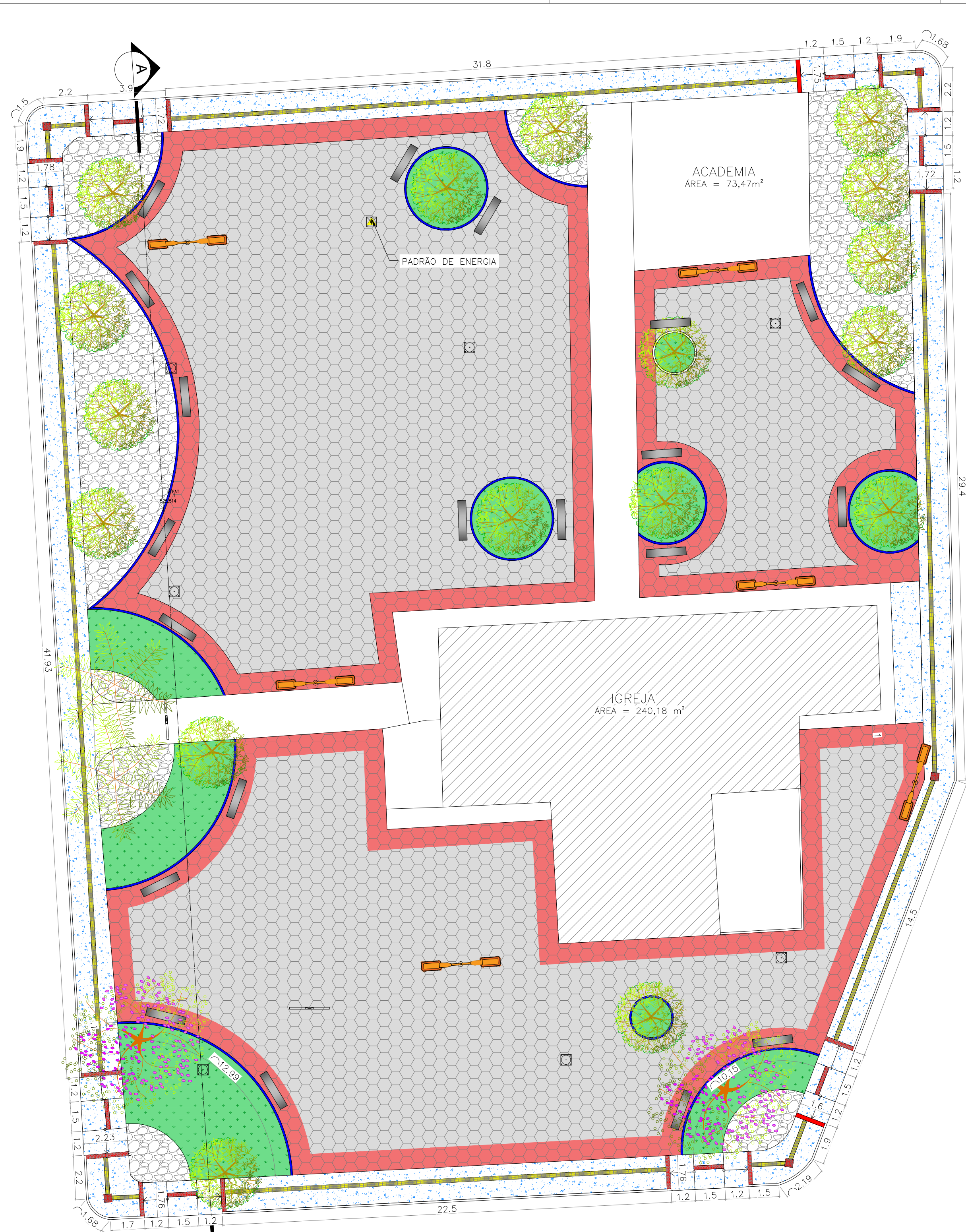
04 LAYOUT DE CONSTRUÇÃO ESCALA 1:150