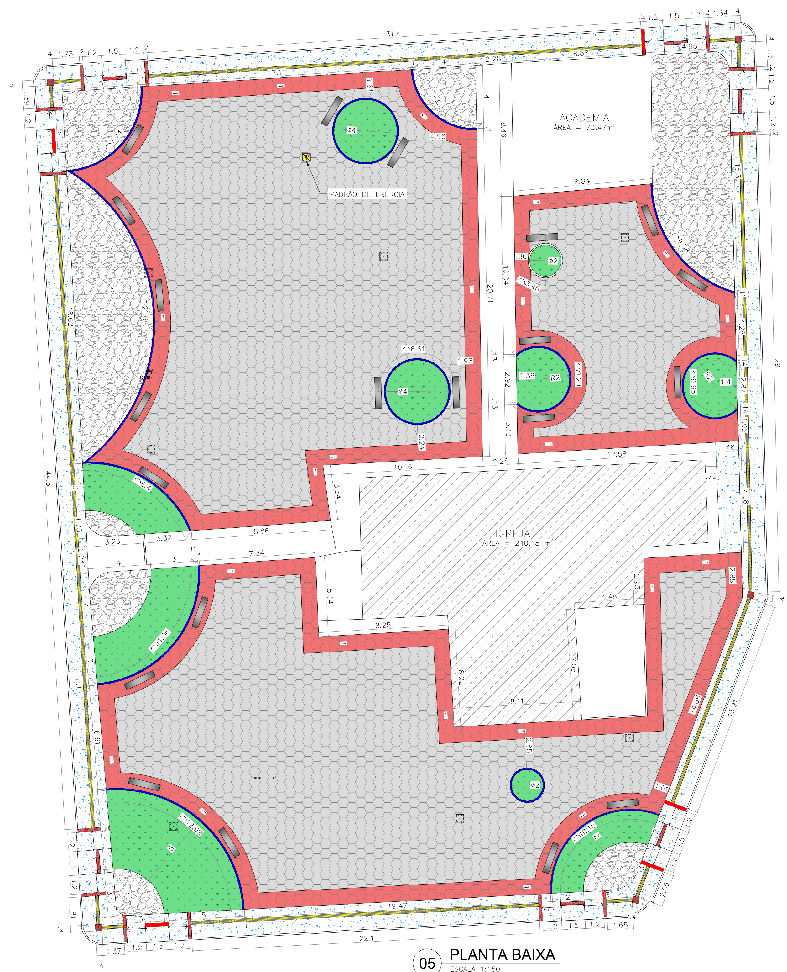
05 PLANTA BAIXA ESCALA 1:150