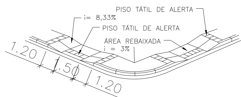
06 PERSPECTIVA RAMPA DE ACESSIBILIDADE ESCALA 1:100