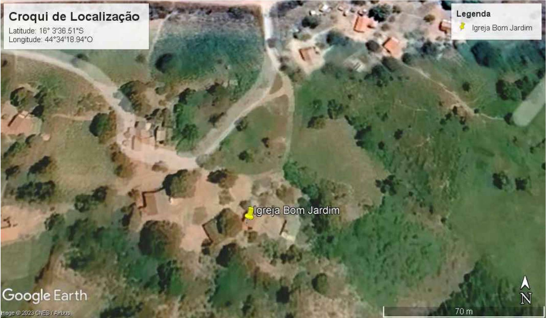
CROQUI DE LOCALIZAÇÃO SEM ESCALA