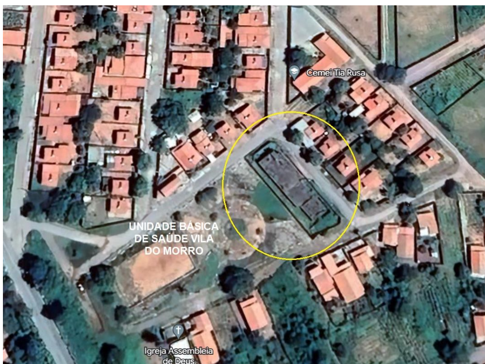
Figura 01: Localização.

A Unidade Básica de Saúde Vila do Morro, localiza-se na Rua T, esquina com a Rua V, S/Nº, no Distrito de Vila do Morro em São Francisco – MG.